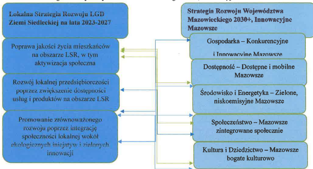
Rysunek nr 2 Powiązania celów LSR LGD Ziemi Siedleckiej na lata 2023-2027 z obszarami Strategii Rozwoju Województwa Mazowieckiego 2030+, Innowacyjne Mazowsze

Mazowsze ma charakter zintegrowany. Głównym celem w/w strategii jest „Zapewnienie wysokiej jakości życia poprzez trwały i zrównoważony przestrzennie rozwój województwa, służący wzrostowi znaczenia regionu w Europie i na świecie, przy poszanowaniu zasobów środowiska”. Szczegóły powiązania celów LSR LGD Ziemi Siedleckiej na lata 2023-2027 do obszarów objętych wsparciem w Strategii Rozwoju Województwa Mazowieckiego 2030+, Innowacyjne Mazowsze przedstawia poniższy rysunek.