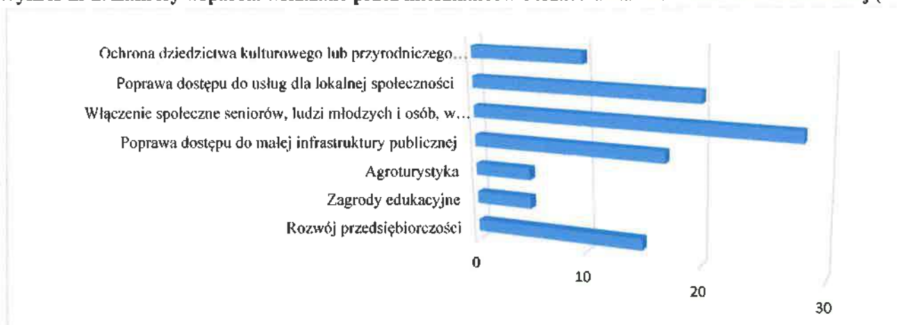
Wykres nr 2. Zakresy wsparcia wskazane przez mieszkańców obszaru działania LGD Ziemi Siedleckiej (%)

W kolejnym etapie konsultacji zbierane dane posłużyły do doprecyzowania zakresów wsparcia, które zawarte będą w LSR. Szczegółowe informacje na poniższym wykresie.