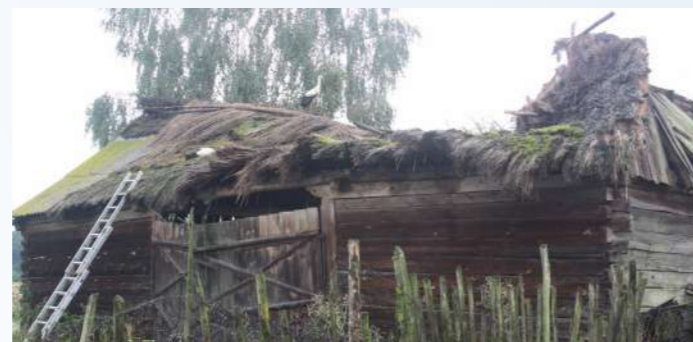
Na ratunek bocianom z gminy Wodzinie