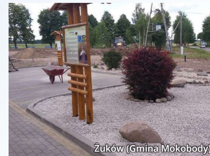
Żuków (Gmina Mokobody)