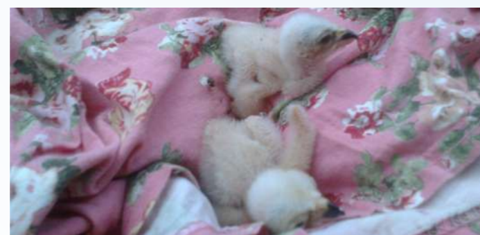
Młode błotniaki łąkowe