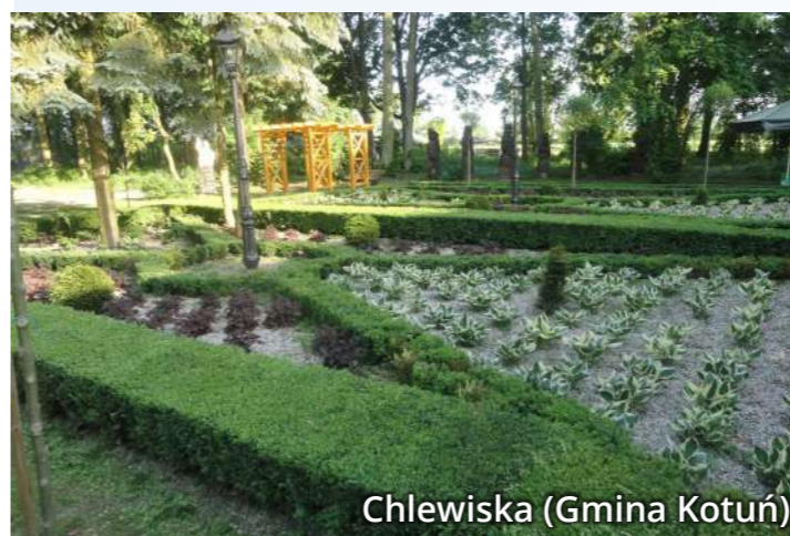
Chlewiska (Gmina Kotuń)